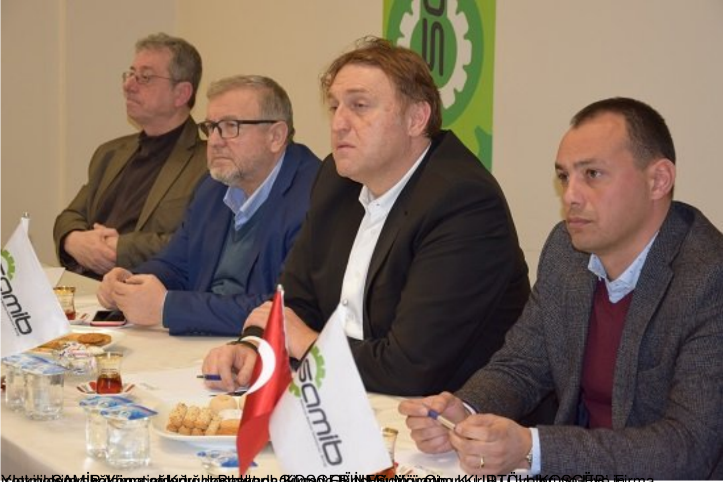
Şirketin SAMiB Üyesi olduğu ve Bankada KOCACI İNŞAATÇI KURUŞULU Üyesi olduğu Firma